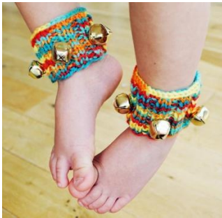
Колокольчики на ножка

извлекать деревянной палочкой (громкий, звонкий) или метелочкой для коктейля (шуршащий, легкий), проводя ее по трещотке сверху вниз.